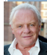
ANTHONY HOPKINS DARÁ VIDA A ALFRED HITCHCOCK

Acceda a la mayor base de datos en ESPAÑOL sobre cine mundial