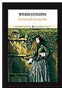
W. Collins La reina de corazones Funambulista